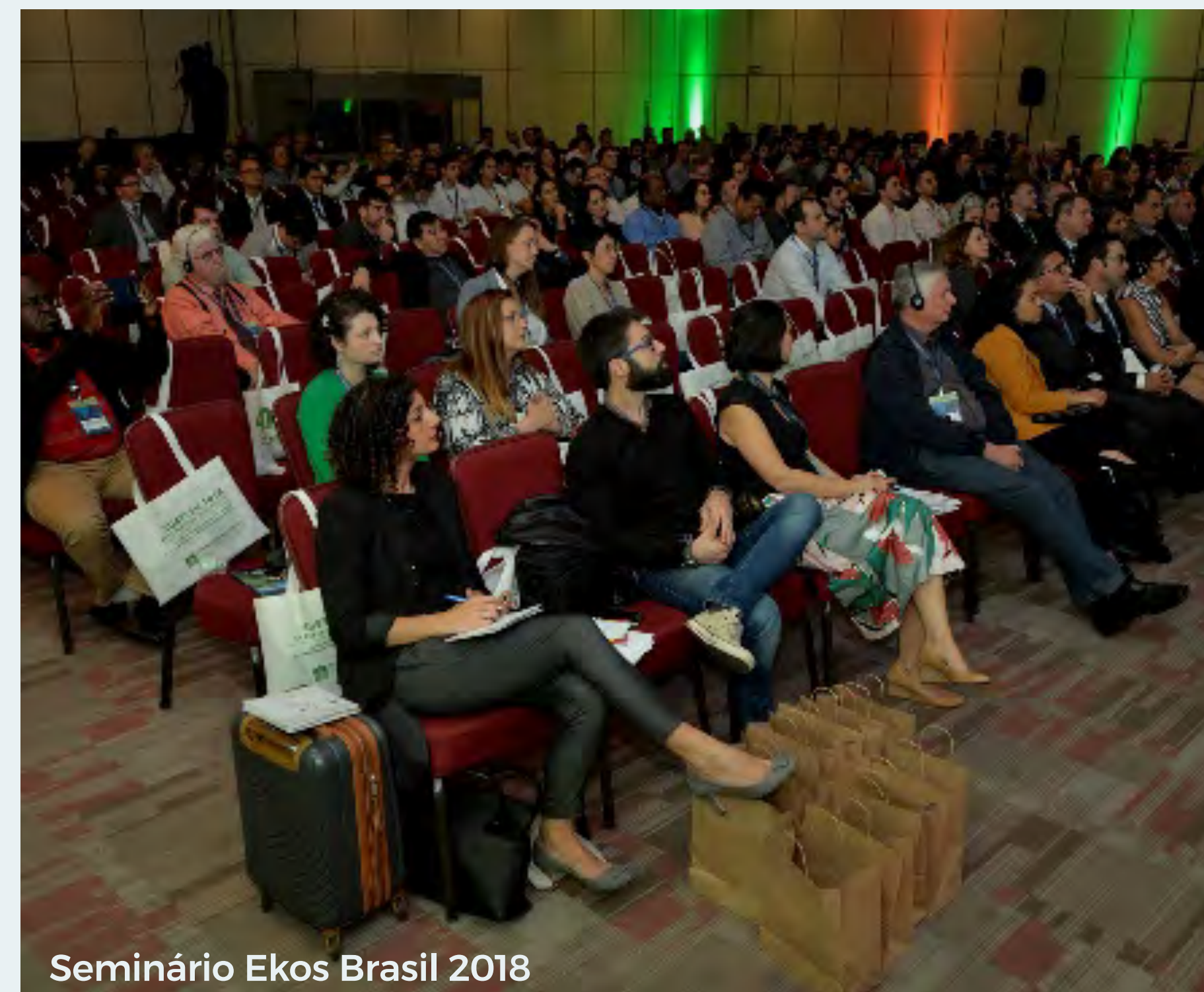
Seminário Ekos Brasil 2018

SEMINÁRIO SOBRE REMEDIAÇÃO E REVITALIZAÇÃO DE ÁREAS CONTAMINADAS